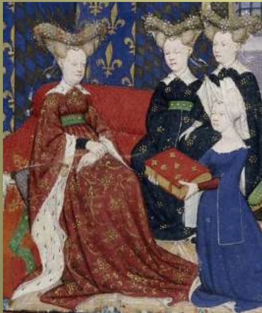
Christine de Pisan offre une de ses œuvres à Isabeau de Bavière

Premièrement elle écrit " Le Livre des cent ballades " dans lequel elle pleure son défunt mari et traite de son isolement, de sa condition de femme au milieu de la cour hostile. La composition obtient un grand succès et lui porte la protection de puissants.