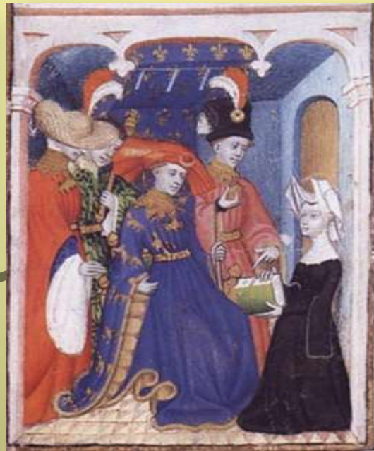
Christine présente au duc de Bourgogne son récit de la vie de Charles V