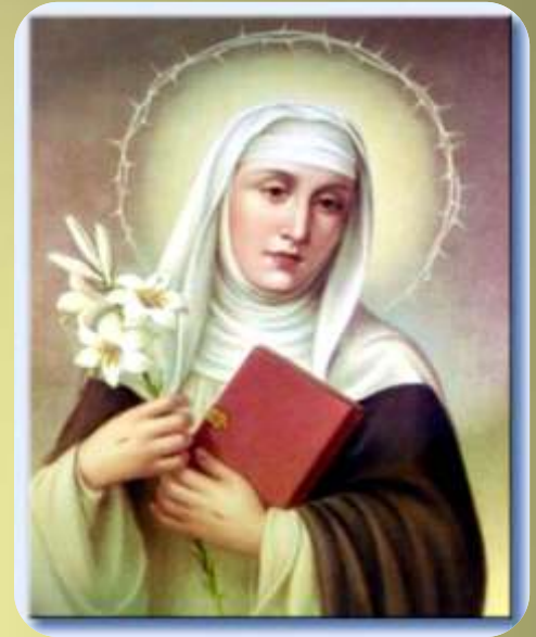
Santa Caterina da Siena